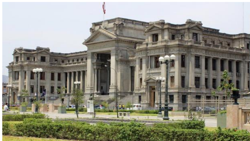
Palacio de Justicia. (Foto: Jorge Coaguila / El Comercio).

Compartir 341 | Twittear | G+ 0 | 22 | 1 | 9